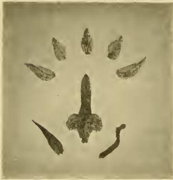
Fig. 6. Blütenanalyse von Orchis Pontica Fleischm. et Hand.-Mzt. Nat Gr.

Tubera palmata, altiuscule in quaternas plerumque partes fissa; radices filiformes. Caulis strictus, erectus, 20—40, plerumque ca. 30 cm altus, fistulosus, ad basin vaginis 1—2 plerumque brevissimis instructus. Folia 4—8, oblique patula, plana; 3 infima lanceolata (1:5—8), latitudine maxima in medio circa; superiora sensim bracteiformia, folium supremum quoque spicae basin non attingens. Spica elongato-cylindrica densiuscula, 10—15 cm longa et plerumque 2.5 cm lata. Bracteae herbaceae, anguste lanceolatae, latitudine maxima prope basin, tri—quinenerviae, floribus aequilongae vel paulo longiores. Germen sessile, tortum, curvatum. Tepala libera; sepala lateralia patula, oblique ovata, acuta, trinervia, sepalo-dorsali ovato, cum petalis connivente longiora; petala sepalo dorsali aequalia, oblique ovata, acuta, sparse reticulari-venosa, nervis longitudinalibus plerumque binis. Label-